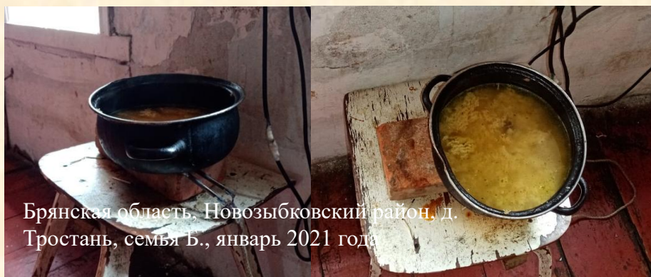
Брянская область, Новозыбковский район, д. Тростань, семья Б., январь 2021 года