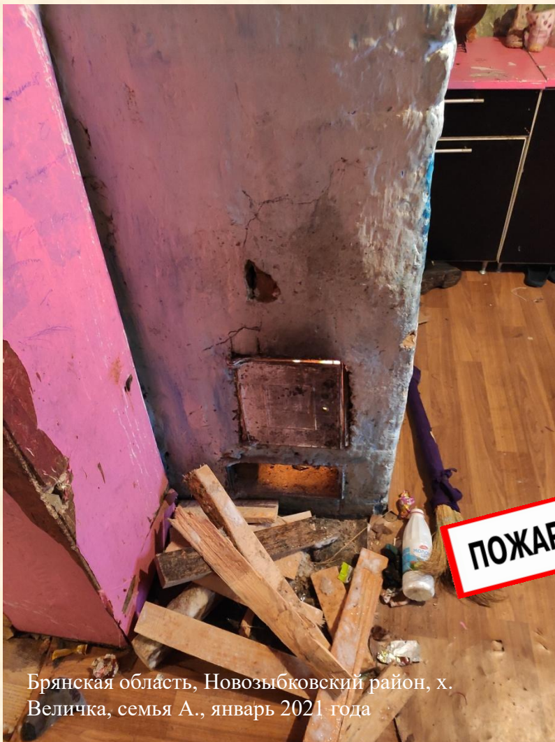
Брянская область, Новозыбковский район, х. Величка, семья А., январь 2021 года