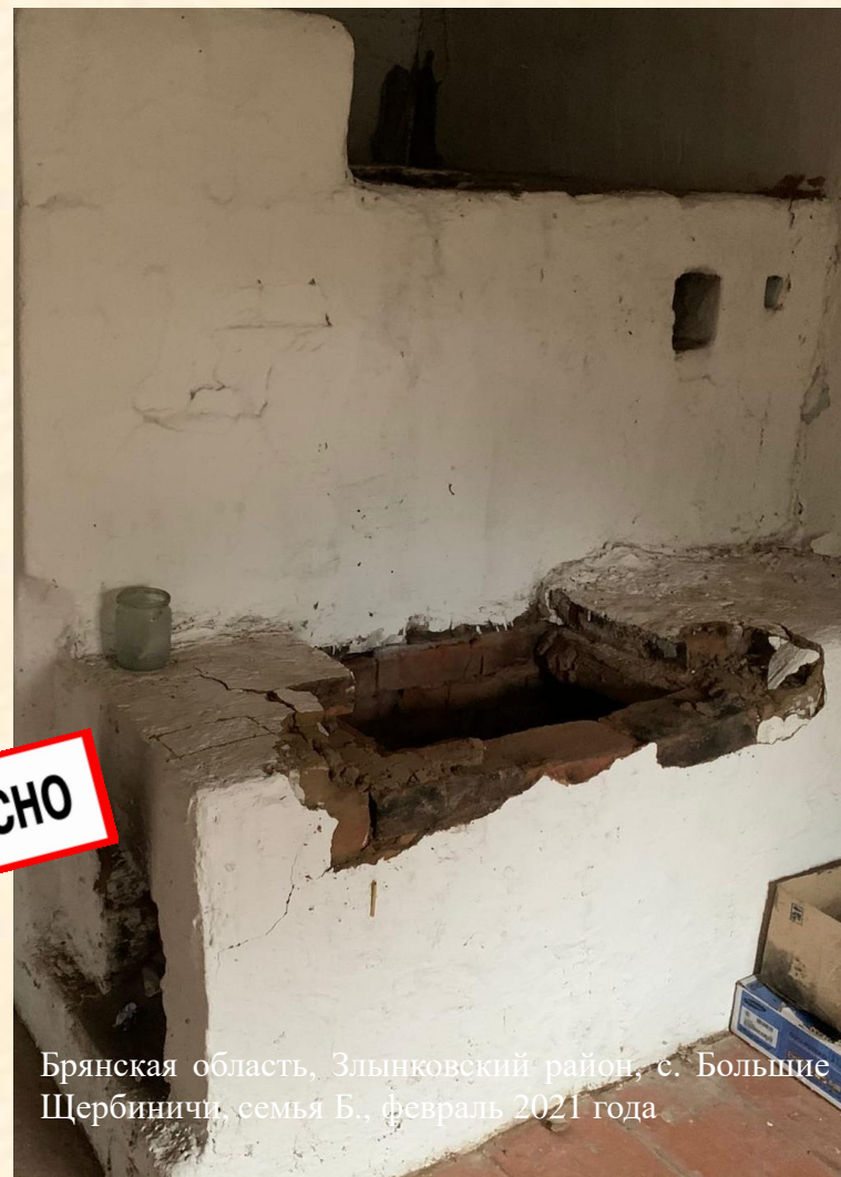
Брянская область, Злынковский район, с. Большие Щербиничи, семья Б., февраль 2021 года