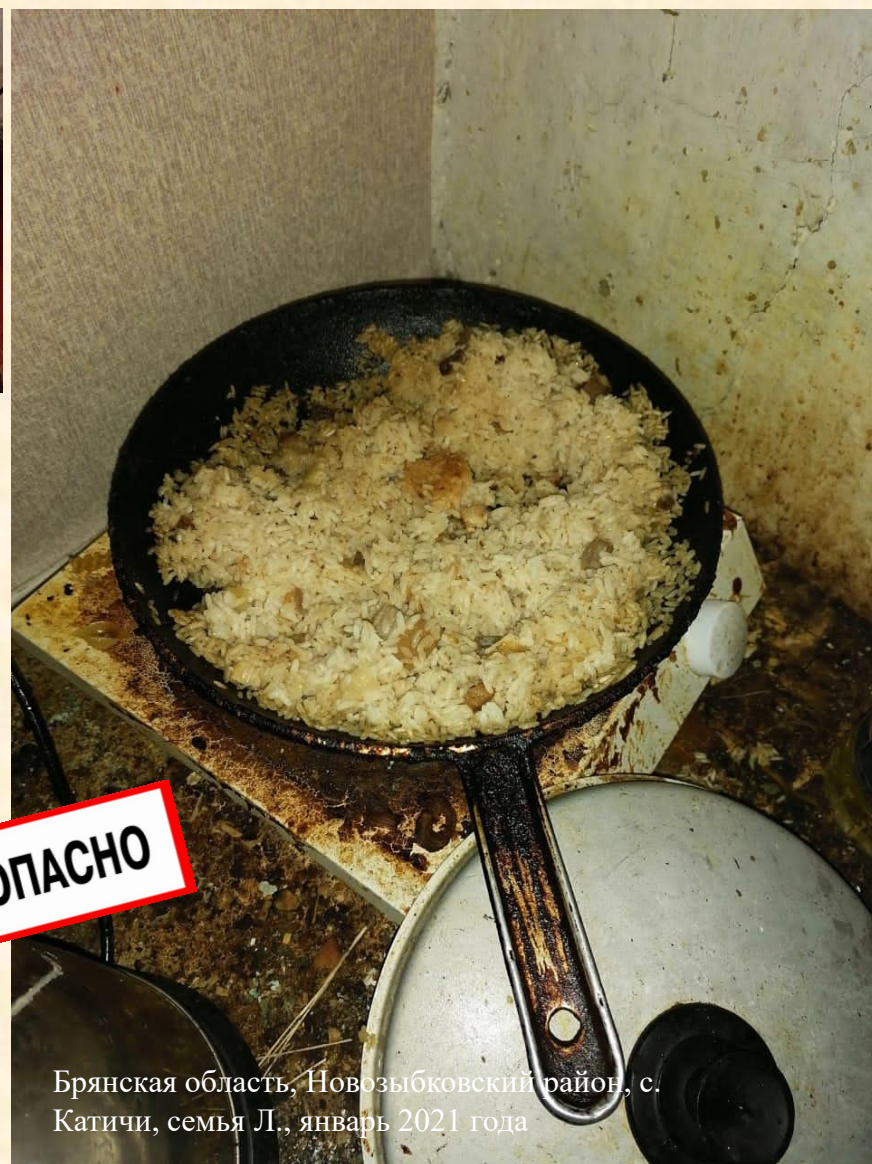
Брянская область, Новозыбковский район, с. Катичи, семья Л., январь 2021 года