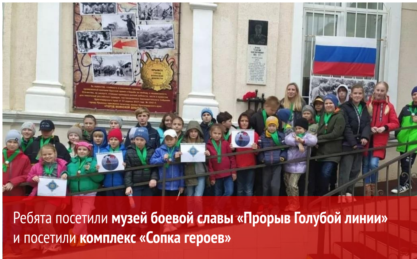
Ребята посетили музей боевой славы «Прорыв Голубой линии» и посетили комплекс «Сопка героев»