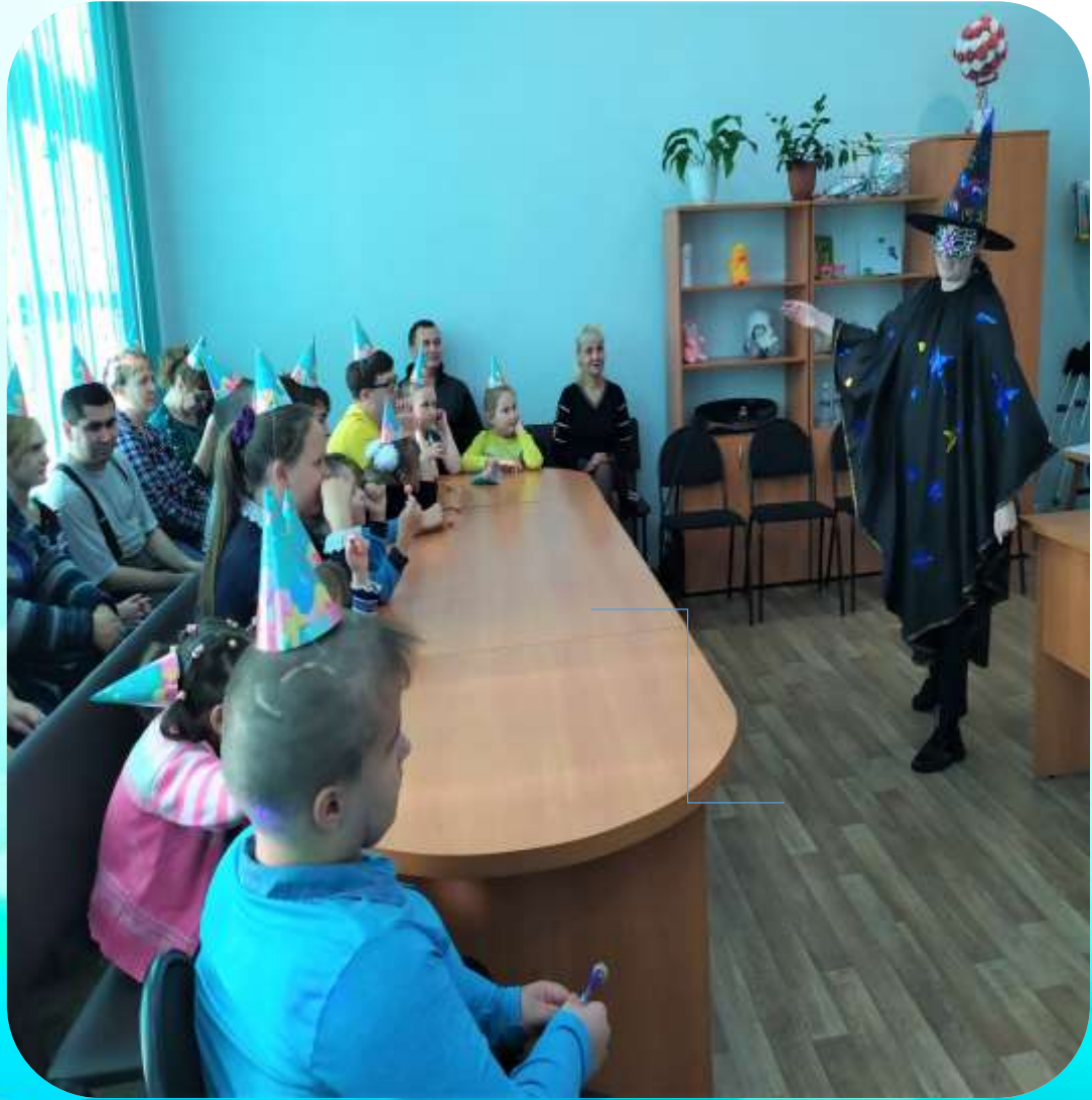
Открытие «Родительской приёмной»